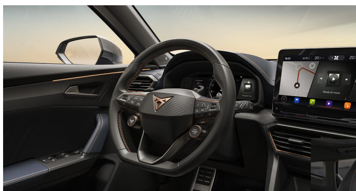
Volant Supersport (P1V)

** využívanie niektorých aplikácií z ponuky infotainment apps vyžaduje zakúpenie dátových balíčkov