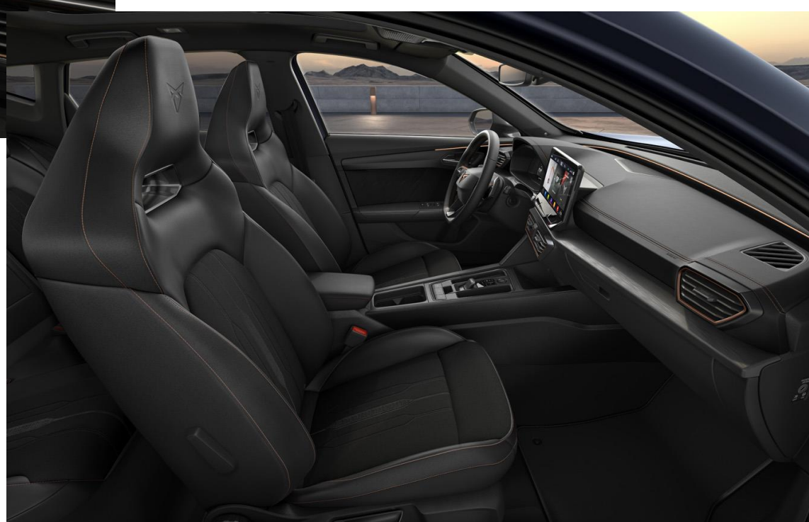
Sériové potahy pre Formentor Veloz